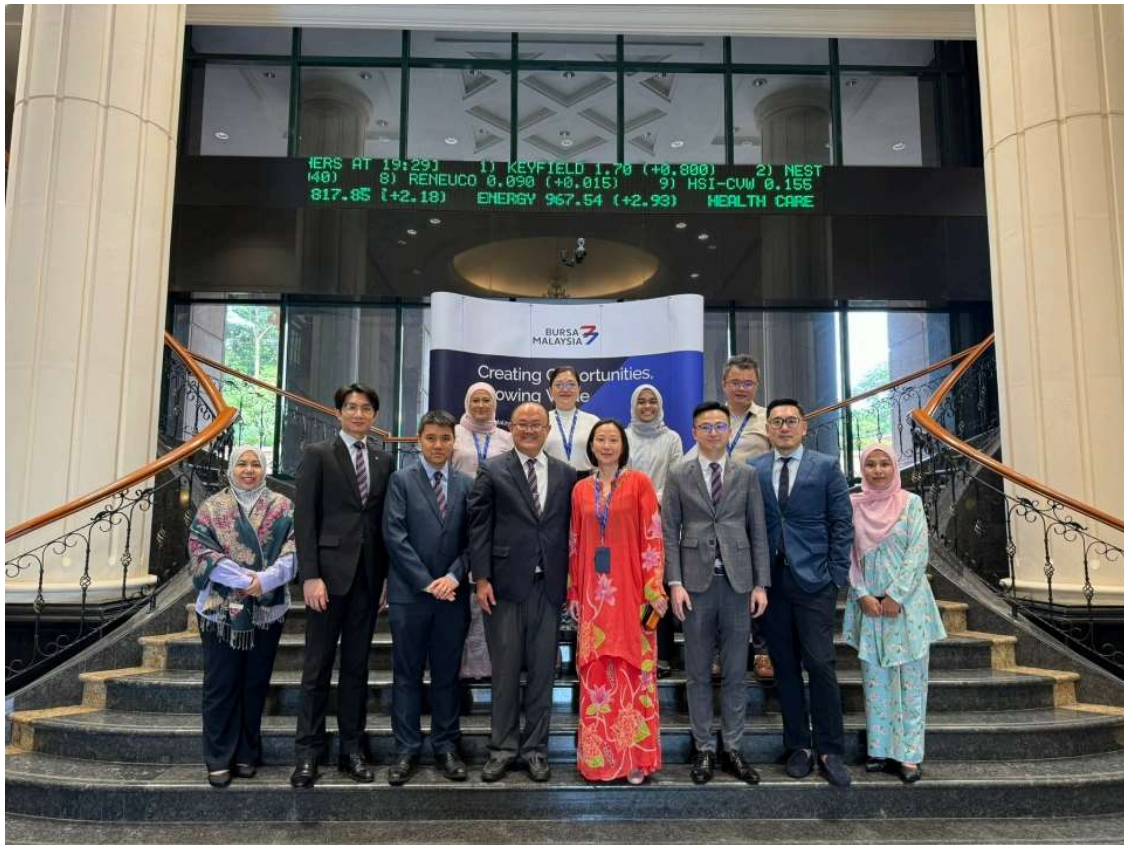
香港證券及期貨專業總會早前到吉隆坡取經。